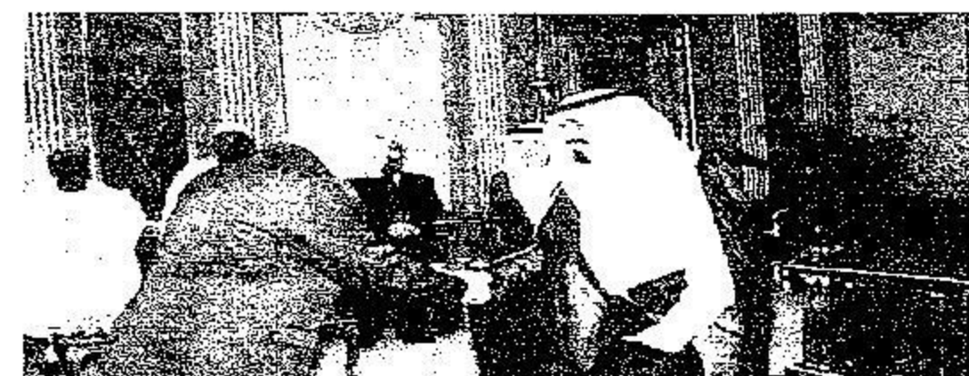
خادم الحرمين لدى استقباله عدد من السفراء

ولي العهد نائب رئيس مجلس الوزراء وزير الدفاع والطيران والمفتش العام وصاحب السمو الأمير الدكتور بندر بن سلمان بن محمد آل سعود مستشار خادم الحرمين الشريفين، كما حضره من الجانب المالي معالي وزير الخارجية مختار وان وسفير مالي لدى المملكة ناكوكتي ديابكتي. ومن جانب آخر بحث خادم الحرمين الشريفين الملك عبدالله بن عبدالعزيز آل سعود حفظه الله في مكتبه بقصر السلام أمس وزير دولة رئيس وزراء جمهورية مالي عثمان ايسوفي. ونقل دولته لخادم الحرمين الشريفين خلال الاستقبال تحيات وتقدير فخامة الرئيس أسادو توماسي توري رئيس جمهورية مالي فيما حمله الملك المفدى تحياته وتقديره لفخامته. كما جرى بحث مجمل الأحداث والتطورات على الساحتين الإقليمية والدولية إضافة إلى اتفاق التعاون بين البلدين وسبل دعمه وتعزيزه في جميع المجالات ما يقدم مصالحهما المشتركة. حضر الاستقبال صاحب السمو الملكي الأمير سلطان بن عبدالعزيز ولي العهد نائب رئيس مجلس الوزراء وزير الدفاع والطيران والمفتش العام وصاحب السمو