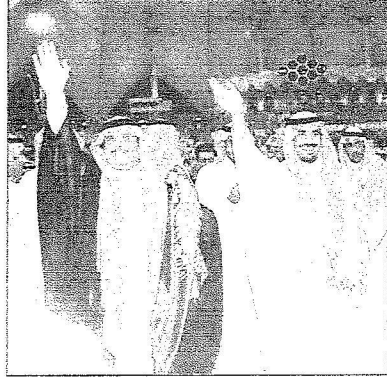
جيدود كبيرة للأمير سلطان بن فهد

بن فهد في أياكم العمل للخدمة الشباب والرياضة؟ - لعلني اعتبر نفسي محظوظا ولله الحمد باتني قريب من العمل الشبابي