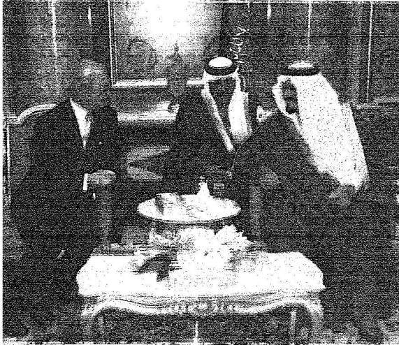
الأمير سلطان لدى استقباله للعاهل السويدي في الرياض أمس