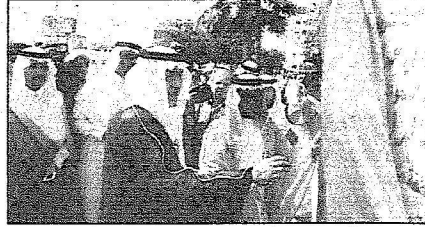
الأمير خالد الفيصل أثناء تمشين نفق وجسر طريق الملك عبدالله

الأمير خالد الفيصل دشّن طريق الملك عبدالله في جدة بتكلفة ٢٩٠ مليون ريال