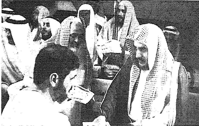
الوزير أثناء توزيع المطبوعات على الحجاج

جهود كبيرة من وزارة الشؤون الإسلامية لتوعية ضيوف الرحمن وإرشادهم