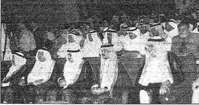
رؤساء تحرير بعض الصحف المحلية أثناء حضورهم الحفل