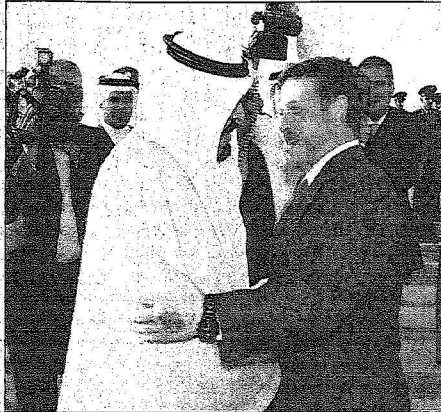
خدم الحرمين يرحب بالملك الأردني لدى وصوله إلى الرياض

حضر المأدبة صاحب السمو الملكي الأمير مشعل بن عبدالعزيز وصاحب السمو الملكي الأمير طلال بن عبدالعزيز رئيس برنامج الخليج العربي لدعم منظمات الأمم المتحدة الإنمائية (الجفند) وصاحب السمو الملكي الأمير نايف بن عبدالعزيز وزير الداخلية وصاحب السمو الملكي الأمير سلمان بن عبدالعزيز أمير منطقة الرياض وأصحاب السمو الملكي الأمراء وأصحاب المعالي الوزراء وكبار المسؤولين من