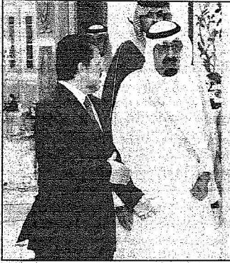
خادم الحرمين في وداع ملك الأردن (و.أ.س)