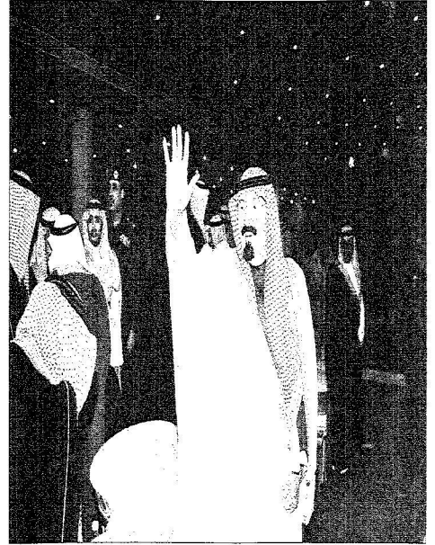
الملك يحيي الحضور خلال زيارته حفل افتتاح مهرجان الجنادرية بأمن.

السعوديون يحملون نماذج التراث بأيديهم وأصواتهم تصلح بمسيرة التوحيد