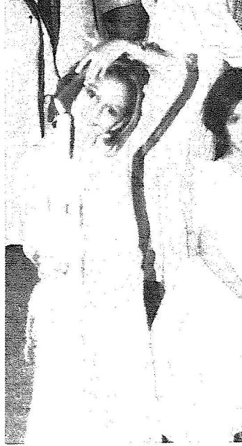
براءة الطفولة كانت حاضرة