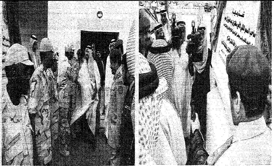
الأمير سلطان يفتتح مشروع ميدان رملية البيات التكيي بالمنطقة الشمالية