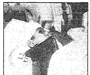
أصفر الجرحى الواصلين