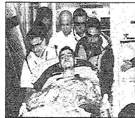
إزالة أحد المصابين من الطائرة