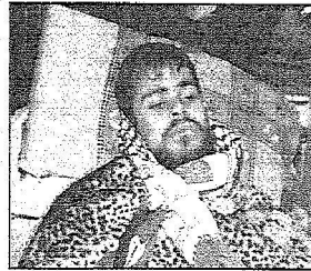
أحد الجرحى لدى وصوله