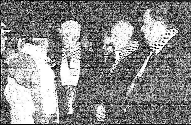
السفير جمال يتابع وصول الجرحى الفلسطينيين

مراقبو الجرحى يعبرون عن شكرهم وامتنانهم للمملكة قيادة وشعباً