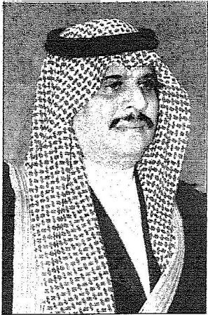
الأمير سلطان بن فهد