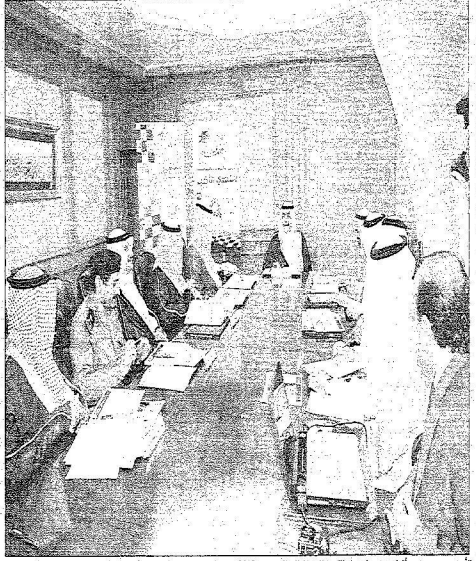
الأمير محمد بن فهد أثناء تزعمه اجتماع اللجنة العليا الرالي السعودية 2008م