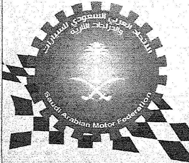
شعار الاتحاد السعودي للسيارات