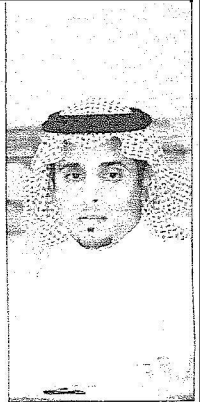
الأمير خالد بن سلطان بن عبدالعزيز آل سعود الفيصل بطل الراليات السعودي

الصبان أعلن اعتزاله في المؤتمر الصحفي ورفض من قبل اللجنة