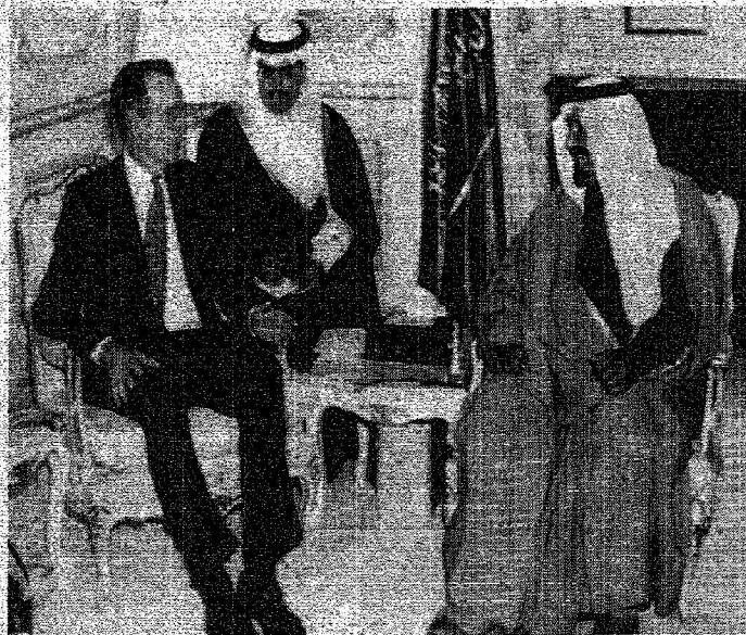
... ومع الرئيس الأميركي السابق جورج بوش