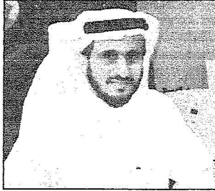
د. عبدالله المروري

- ضيف اللقاء الدكتور حسين بن محمد الفريقي الأمين العام للهيئة السعودية للتخصصات الصحية يعد أحد القيادات الصحية في المملكة التي نال لها دور بارز في المساهمة في تطوير القطاع الصحي من خلال