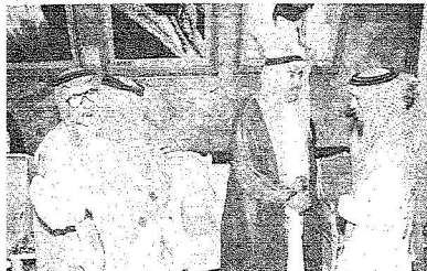
محافظ الطائف يستقبل المواطنين وشيوخ القبائل