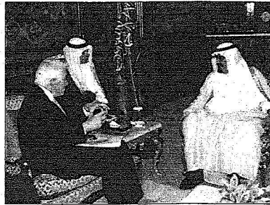
ويستقبل المدير العام التنفيذي لغرفة التجارة الأمريكية