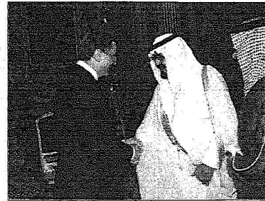
الملك يستقبل رئيس مجلس الأمة التركي والوفد المرافق له