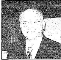
الأمين العام لمنظمة المؤتمر الإسلامي د. اعمل الدين أوغلي

* كيف تجدون هذا الإقبال الدولي كمنظمة الأمم المتحدة ومنظمة المؤتمر