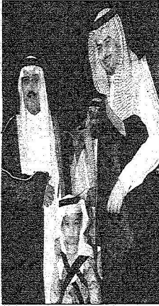
الأمير أحمد بن عبدالعزيز بن سعود بن عبدالعزيز آل سعود