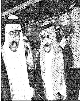
الأمير أحمد بن عبدالعزيز بن سعود بن عبدالعزيز آل سعود