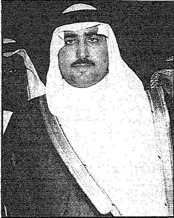
الامير فيصل بن احمد

- سمو الأمير سلمان بن عبدالعزيز أمير منطقة الرياض كان حاضرا الحفل بمشاعره الأبوية لكنه لم يتمكن من الحضور الشخصي حيث كان سموه قد سافر إلى الكويت مع سمو الأمير متعب بن عبدالعزيز وزير الشؤون البلدية والقروية ممثلين خادم الحرمين الشريفين في التعزية بوفاة الشيخ سعد العبدالله... وعاد مباشرة إلى استاذ الملك فهد ليكون في مقدمة مستقبلي خادم الحرمين الشريفين الملك عبدالله بن عبدالعزيز عند وصوله لرعاية المباراة النهائية بين الشباب والاتحاد على كأس الملك..