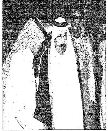
لحظة وصول الأمير لثيف