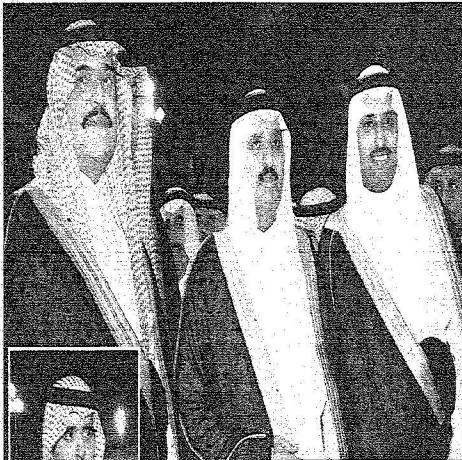
الأمير أحمد بن عبدالعزيز بن سعود بن عبدالعزيز آل سعود مع الأمير عبدالمعز بن سعود