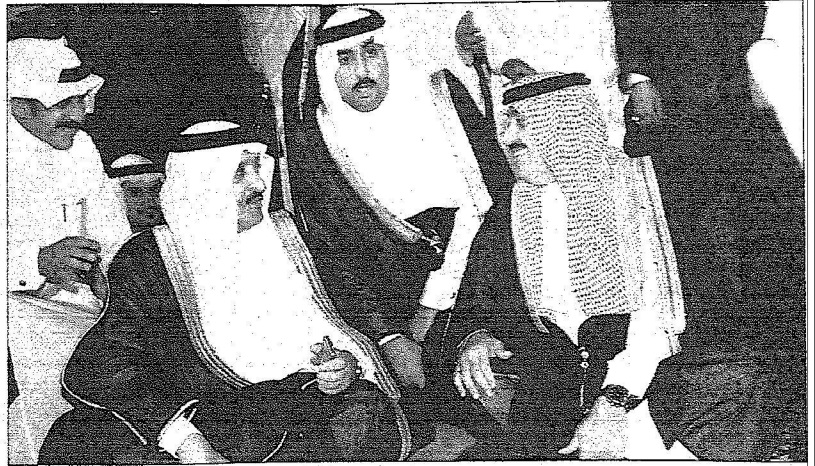
الأمير أحمد يتلقى التهنئة من الأمير متعب بن عبدالله وبينهم الأمير فيصل