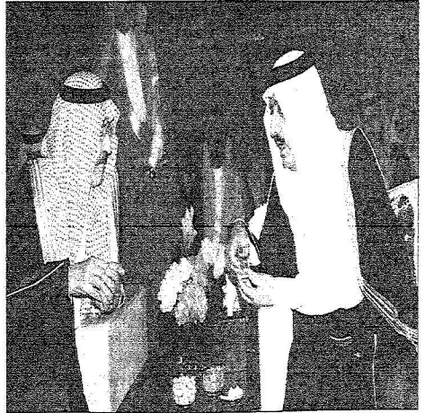
الأمير أحمد بن عبدالعزيز بن سعود في حديثه مع الأمير عبدالمعز بن سعود