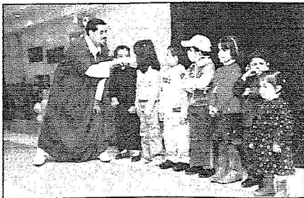
شعاليات متنوعة للمرضى بالمستشفيات