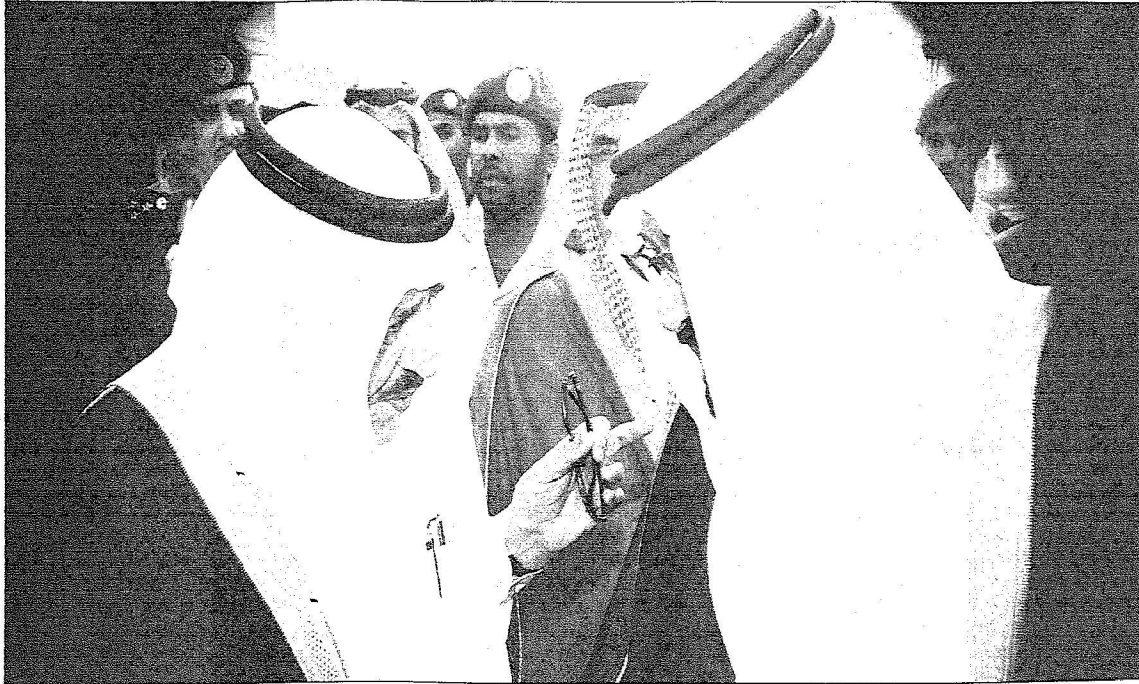
الملك والقائب الثاني .. خط تواصل دائم