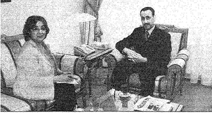
السفير شيكشي يتحدث للزميلة عبود مكرم