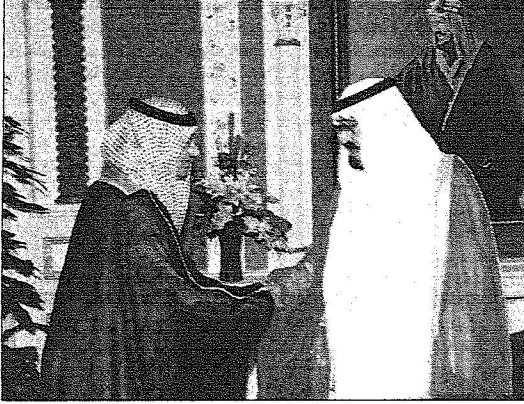
ويستقبل السفير المعين لدى النمسا

بن عبدالعزيز مستشار خادم الحرمين الشريفين وصاحب السمو الملكي الأمير منصور بن ناصر بن عبدالعزيز مستشار خادم الحرمين الشريفين وصاحب السمو الأمير الدكتور بندر بن سلمان بن محمد آل سعود مستشار خادم الحرمين الشريفين وصاحب السمو الملكي الأمير عبدالعزيز بن فهد بن عبدالعزيز وزير الدولة عضو مجلس الوزراء رئيس ديوان رئاسة مجلس الوزراء .