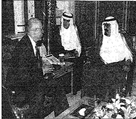
وزير الخزانة الأمريكي