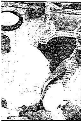
خطوان من المجلس البلدي يرحمجان في اللقاء

مشروع مياه في صيبا وسدود في القري ووسام ودعال إنشاء معاهد مهنية وكليات تقنية بالمنطقة