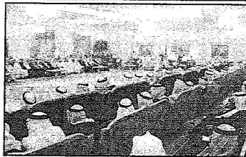
الحضور من أعضاء المجالس والمشايخ والأعيان ووزراء الدوائر الحكومية بجازان