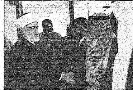
سفيرة خادم الحرمين في بيروت يتلقى التلاوي من المفتي محمد رشيد قبايبي

العواصم - مكاتب الرياض، عماد سارة، محمد أحمد طيار، أحمد حسين البامي، جمال شتيوي، سعد العجمي، سيمون نصار، تصوير: شمعون ضاهر