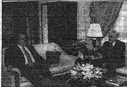
سفيرة خادم الحرمين الشريفين في بروناي يستقبل المعزين