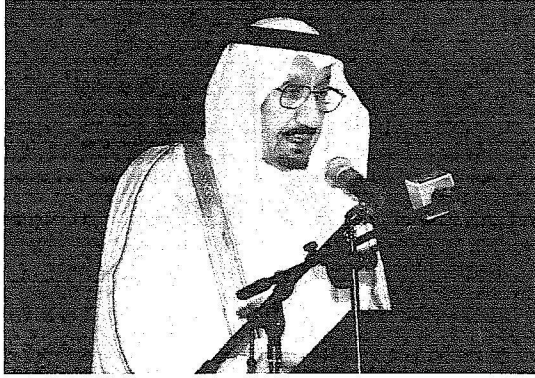
الأمير متعب يستعرض مشاريع "البيدات" أمام الملك وبني المهدي.

الشعبى، تفخيرا بتقديم خدماتها لفئات متعددة من المواطنين بشكل مباشر وغير مباشر، مبيّنا أن الضمان الاجتماعي يقوم برعاية أكثر من 450 ألف أسرة تتسلم مخصصاتها البالغة 560 مليون ريال شهريا بوساطة الصرف الآلي بيسر وسهولة.