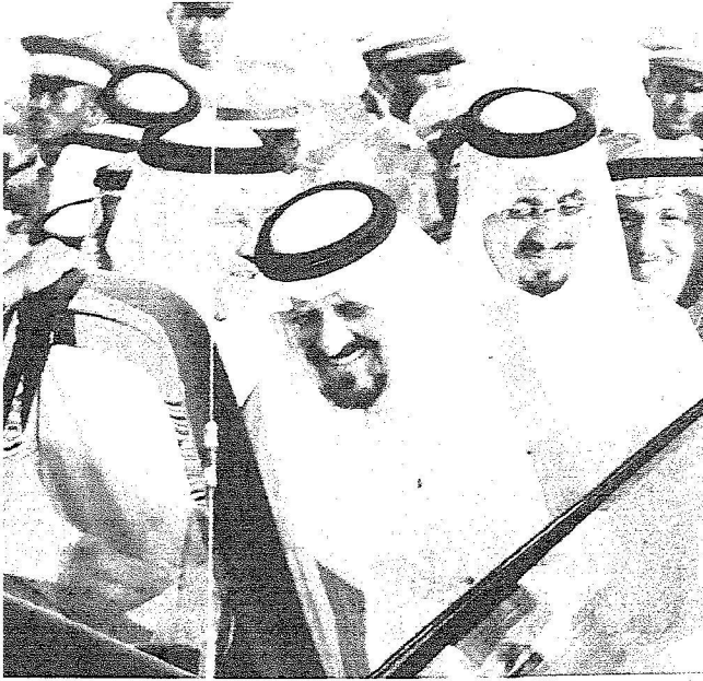
الأمير سلطان لدى وصوله مقر الحفل.