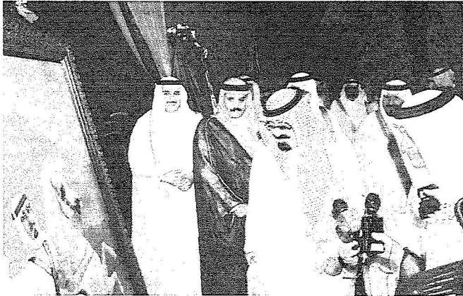
.. وهنا يشاهد لوحات تشكيلية في المعرض المصاحب لاحتفال المشاريع الجديدة.