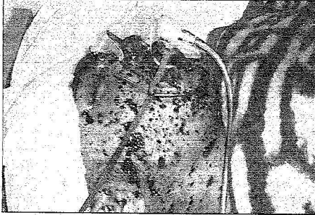
الصاب مسموم الزيرة