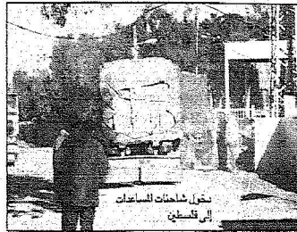
دخول شاحنات المساعدات إلى فلسطين