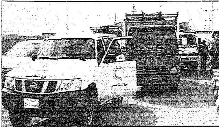
دخول شاحنات المساعدات إلى فلسطين