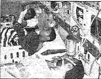
تجهيزات عالية في الإخلاء الطبي لنقل الضحايا