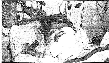
المصابة تاج الغفري