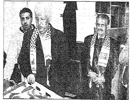
السفير الفلسطيني لدى استقباله المصابين والجرحى

147 طنّاً من الأدوية والمستلزمات دخلت لفلسطين ونقل 50 مصاباً وجريحاً حتى اليوم لعلاجهم في الرياض