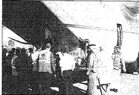
الاخلاء السعودية تتخلل مساعدات الملكة لغير ربيع