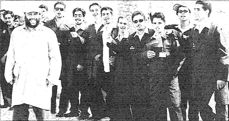
عدد من الطلاب يرتدون المئزر التخرجي وقد اصطفوا لاستقبال الملك قبل تدمينه مشاريع المؤسسة العامة للتعليم الفني والتدريب المهني.

والتربية والتعليم في كل محافظة وسأل الله أن يحفظ خادم الحرمين الشريفين وولي عهد الأمين كما قدم شكره لأمير المنطقة على متابعتها الدائمة لاحتياجات المنطقة