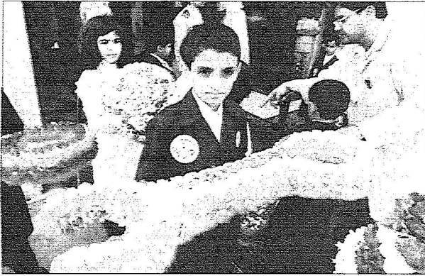
.. وهنا أحد الأطفال يرتدي زيا مهتيا ويبيده مفتاح من الورود في جناح مشاريع المؤسسة العامة للتعليم الفني والتدريب المهني.