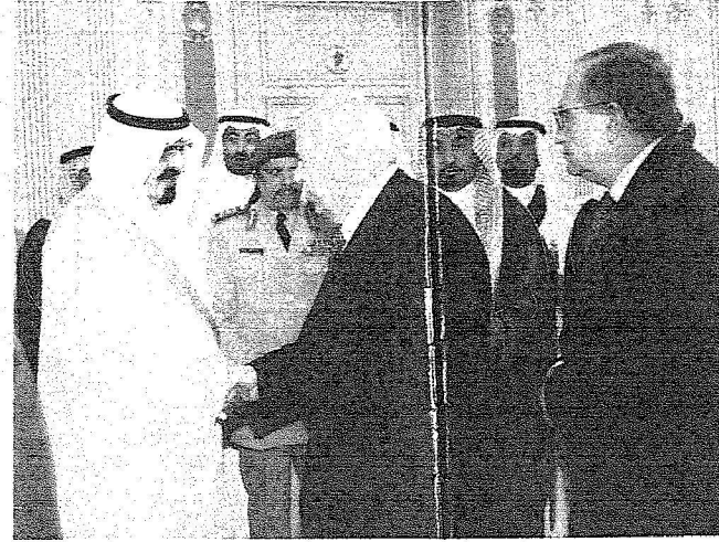
الملك عبد الله لدى استقباله وفد رجال الأعمال اللبناني.

البحرين الشريفين الملك فهد بن عبد العزيز آل سعود . رحمه الله . وأوضح فضيلته أن المسلمين هناك مرحابون تمام الراحة لكلمتي خادم