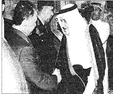
الأمير نايف يصافح العاهل الأردني

كما تناولت المحادثات أفاق التعاون بين البلدين الشقيقين وسبل دعمها وتعزيزها في جميع المجالات بما يخدم مصالح البلدين والشعنين الشقيقين . حضر الاجتماع صاحب السمو الملكي الأمير نايف بن عبدالعزيز النائب الثاني لرئيس مجلس الوزراء وزير الداخلية وصاحب السمو الملكي الأمير خالد الفيصل بن عبدالعزيز أمير منطقة مكة المكرمة وصاحب السمو الملكي الأمير عبدالله بن عبدالعزيز مستشار خادم الحرمين الشريفين وصاحب السمو الملكي الأمير مقرن بن عبدالعزيز رئيس استخبارات العامة ومعالي وزير التجارة والصناعة الأستاذ عبدالله بن أحمد زويل الوزير المرافق وسفير خادم الحرمين الشريفين لدى الأردن فهد بن عبدالحسين زايد . كما حضره من الجانب الأردني