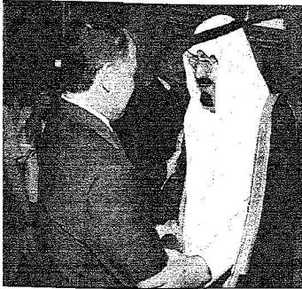
خادم الحرمين يودع المعامل الأجنبي