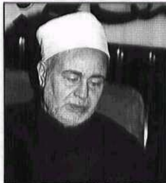
محمد سيد طنطاوي