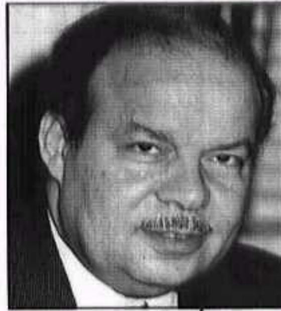
د. أحمد فتحي سرور

مختلف نواحي الحياة، حيث شهدت خلال السنوات الأخيرة قفزة نوعية لا يمكن لعامل أن يتجاهلها (اقتصادياً وثقافياً واجتماعياً). وهذه القفزة هي ثمرة من ثمرات العلم الذي عم المملكة ليشمل كل قرية وكل حي وكل مدينة مما انعكس إيجاباً على معدلات النمو، حيث نمت وازدهرت الحياة في المملكة في كل مجال وعلى كل صعيد، في العمران، والعلوم، والتعليم، والتأهيل، والبحث العلمي والتأليف، والترجمة، والنشر... الخ والجديد في المملكة أننا نشهد تطوراً كبيراً في تخطيط الإدارة، فقد أصبح للمملكة دور ريادي في العالم العربي والإسلامي، وثقل في موازين القوى الاقتصادية والسياسية محلياً وعربياً وعالمياً.. كل ذلك ما كان ليتحقق لولا الوحدة الوطنية التي تعيشها المملكة بفضل حكمة وليكها جلالة الملك عبد الله بن عبد العزيز الذي استطاع أن يجعل من المملكة منارة بكل ما تحمل الكلمة من معنى تسترشد فيها الحكومات العربية.