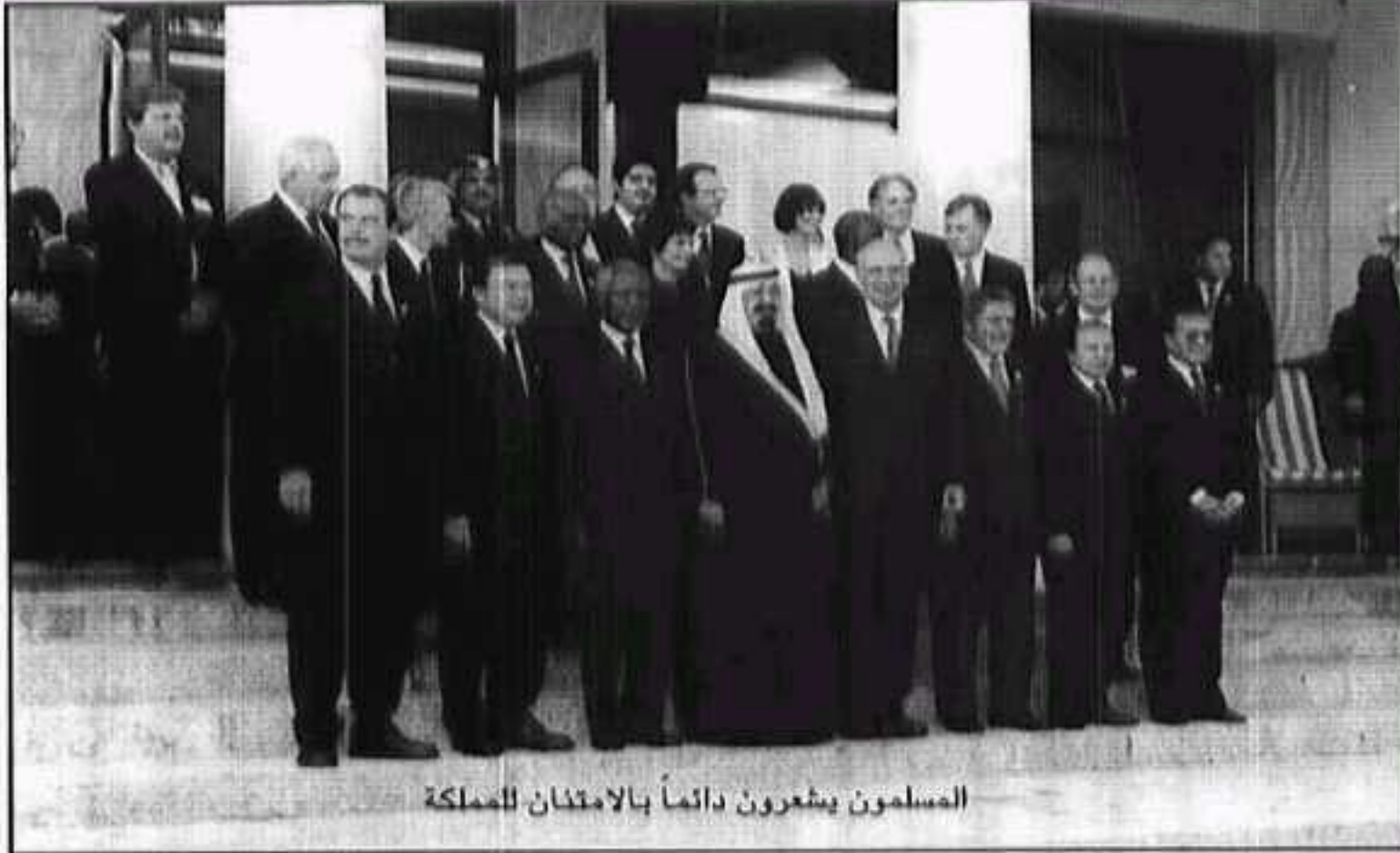
المسلمون يشعرون دائماً بالامتنان للمملكة