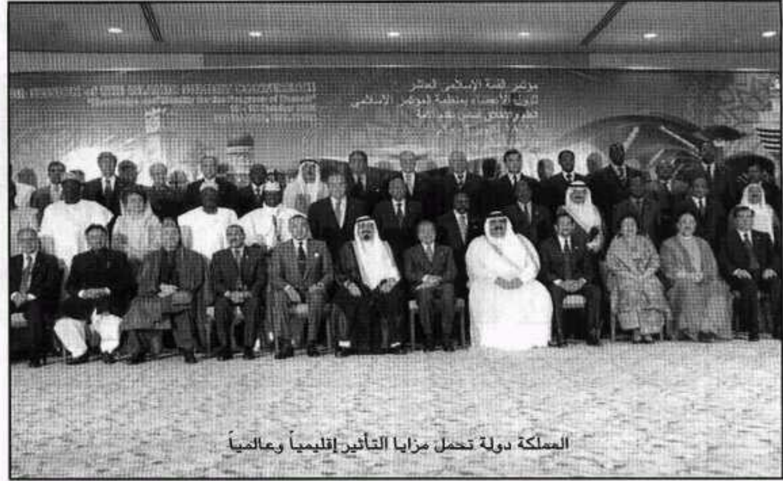
المملكة دولة تحمل مزايا التأثير إقليمياً وعالمياً

ويقول السيد مصطفى نيباس الوزير الأول السنغالي السابق: نحن في السنغال وأفريقيا نفخر بدور المملكة في القارة الأفريقية وخاصة في خدمة الإسلام وفي تنمية الإنسان الأفريقي ومساعدته على الخروج من التخلف والفاقة. كذلك فإن المملكة عامل مهم في المحافظة على التوازن الاستراتيجي في الشرق الأوسط، وهذا يخدم السلام العالمي في جميع الظروف والأحوال.