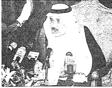
الامير نايف يلقي كلمته في حفل افتتاح المؤتمر

الحج المتعدد.. وما هذا المؤتمر.. مؤتمر سلامة وصحة الحجيج الذي تنظمه وزارة الصحة.. وتشارك فيه الوزارات والجهات الأخرى إلا احد الجهود المتواصلة لخدمة حجاج بيت الله الحرام على أسس علمية صحيحة وتوقع له النجاح - ان شاء الله- فيما سيبحثه من قضايا ودراسات وخطط لاشك من قادتتها لتكامل الخدمة باذن الله.. ونشكر لمعالي وزير الصحة الدكتور حمد المانع والمسؤولين في وزارة الصحة تنظيم هذا المؤتمر وما يقومون به من منصات لخدمة الحجاج. واستطرد قائلاً: نسأل الله العلي القدير ان يوفقنا للخيام