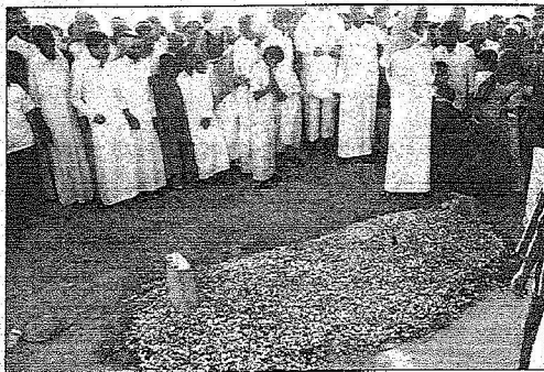
قبر الملك فهد محاط بدعوات المواطنين