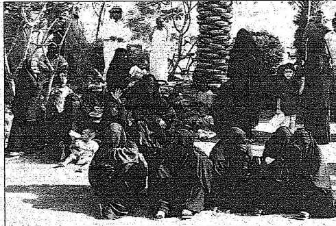
ونساء يبكين الفقيد