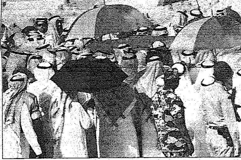
مواطنون اصرروا على توديع قائدهم رغم حرارة الجو