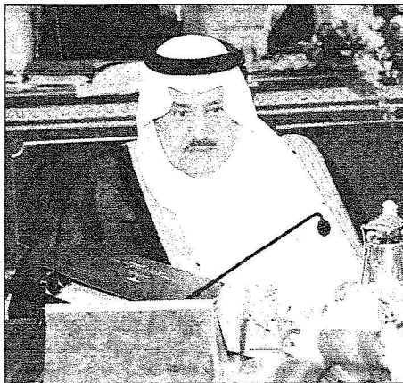
النائب الثاني خلال الجلسة (و.ا.س)

وأشار وزير الثقافة والإعلام إلى أن المجلس تطرق إلى الاستعدادات والخطط الشاملة التي أعدتها وزارة التربية والتعليم بالتعاون مع وزارة الصحة للتوعية بوباء الأنفلونزا المستجدة (N.I.A.H1) مع استيلاء العام الدراسي الجديد بمشيئة الله في جميع مناطق المملكة يوم السبت القادم للمرحلتين المتوسطة والثانوية ويوم السبت بعد القادم للمرحلة الابتدائية وما في حكمها.