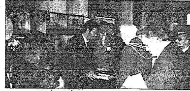
المهندسان العتيق والمحمدي يشرحان أحد الأعمال للأمير ليدز

اختتمت يوم أمس الأول فعاليات مؤتمر الإبداع الثاني والذي نظّمته رئاسة أندية الطلاب السعوديين في بريطانيا وأيرلندا برعاية ودعم سفير خادم الحرمين الشريفين بريطانيا وأيرلندا صاحب السمو الملكي الأمير محمد بن نواف بن عبدالعزيز وإشراف المحلّة جامعة الملك سعود، حيث رعى البروفيسور غازي مكي الملحق الثقافي بريطانيا وأيرلندا والدكتور منصور السعيد وكيل جامعة الملك سعود حفل اختتام فعاليات المؤتمر، والذي تم فيه تكريم أساتذة الجامعات البريطانية والسعودية الذين شاركوا في المؤتمر، بالإضافة إلى تكريم اللجان المنظمة للمؤتمر والإعلاميين الذين حضروا للمؤتمر من عدة قنوات إعلامية مرئية ومقروءة. من جهته أبدى الدكتور منصور السعيد وكيل جامعة الملك سعود الراعي الرسمي للمؤتمر سعاده بما قدمه المؤتمر خلال يومين مشيراً إلى أن ذلك لم