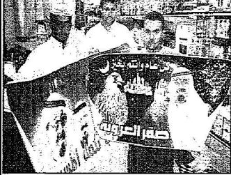
عشرات الترحيب يعقدم خادم الأحساء في كل مكان ابتهاجاً بالزيارة