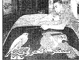
شاه يضع صورة صقر العروبة على سيرته