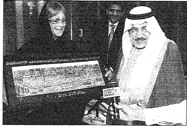
الأمير نايف يتسلم جائزة الأوتروا