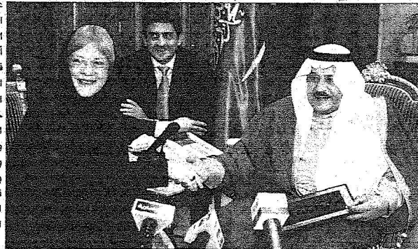
الأمير نايف خلال تكريمه من المنظمة الدولية

وتفردت السيدة كارين أبو زيد خلال اللقاء بتقديم جائزة المانح المتميز الدولية لتخفيف معاناة الشعب الفلسطيني وتغطية العديد من البرامج والنشاطات التي تقوم بها وكالة الأونروا. وشكر سمو الأمير نايف بن