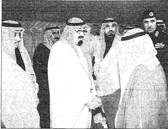
خادم الحرمين الشريفين مصافحا أحد مسؤولي محافظة رماح في روضة خريم أمس.