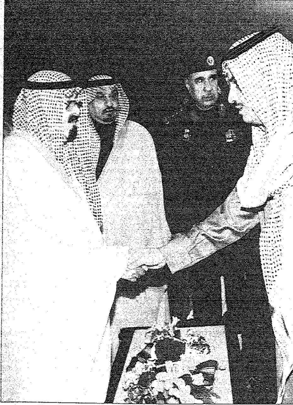
.. ويستقبل المينتين بسلامة الوصول.