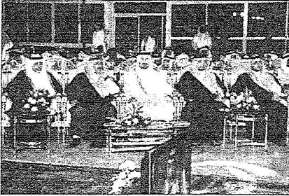
اصحاب السمو الملكي خلال حضورهم المؤتمر الصحفي