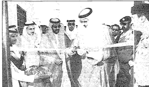
سموه يفتتح عدداً من المشاريع التنموية بالمخواة