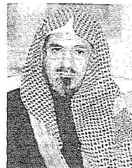
د. صالح بن حميد

وأضاف: ما يقوم به خادم الحرمين الشريفين ينبع من