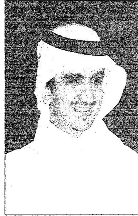
الشيخ الوليد آل إبراهيم