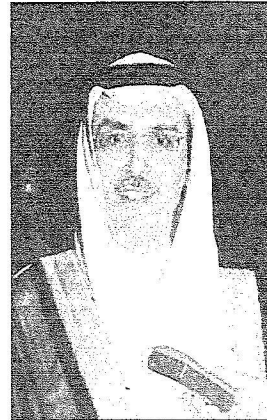
الأمير بدر بن عبد الحسن

تواصل اللجنة المنظمة لمهرجان الجنادرية متابعتها للتحريات النهائية قبل إطلاق البروفات الخاصة بأوبريت «شمس وشعب وملك» والذي سيقدم في حفل افتتاح مهرجان الجنادرية الرابع والعشرين والذي سيتم فيه أيضاً الاحتفال باليوبيل الفضي للمهرجان بمناسبة مرور ٢٥ عاماً من عمره ولم يتوقف سوى عام واحد بسبب أزمة الخليج.