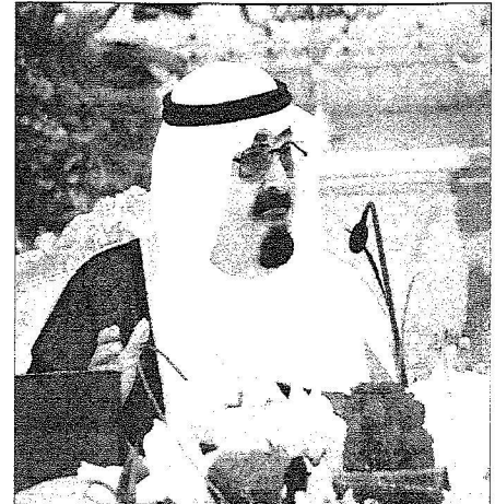
خادم الحرمين مقرناً جلسة مجلس الوزراء