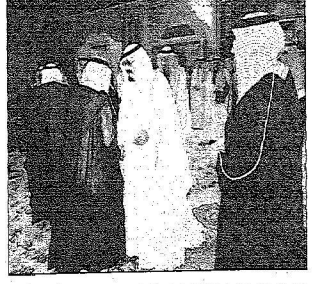
خادم الحرمين خلال استقباله السفراء والمعينين