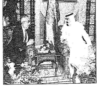
المليك خلال محادثته مع رئيس الوزراء الفلسطيني، ب. قباوض

المليك يعقد جلسة مباحثات مع رئيس الوزراء الفلسطيني ويحتفي به في الجنادرية