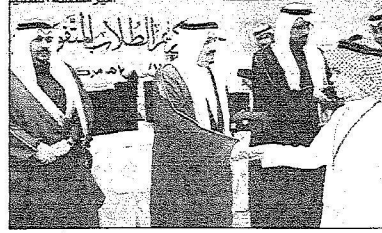
لقطنتان من حفل التكريم

هنا صاحب السمو الملكي الأمير فيصل بن بندر بن عبدالعزيز أمير منطقة القصيم والوطن والمواطنین بمناسبة صدور ميزانحة الخسر، مؤكداً أنها ستكون دافعا لكافة قطاعات الدولة بأن تؤدي دورها كاملا لخدمة المواطن والوطن. وبين سموه عقب تكريمه للطلاب المتفوقين بمنطقة القصيم في الحفل الذي أقامته الإدارة العامة للتربية والتعليم بالمنطقة بحضور