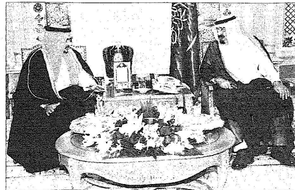
خادم الحرمين الشريفين خلال استقباله ولي عهد البحرين