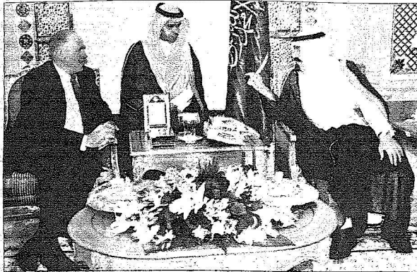
..ويستقبل رئيس الامن القومي الامريكي