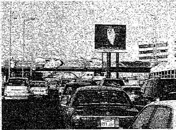
الى جنات الخلد ياتهد