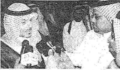
سموه يتحدث للصفيين عقب الحفل