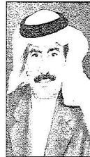
عبدالله النعام - رئيس بلدية طريف