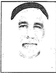
الشيخ صفوان الناهلي