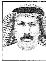
صالح مهدي آل سويد

لمنطقة نجران برتبة وزير.. وقال تقدر و نشن عالياً ما تقوم به حكومتنا الرشيدة في سبيل رفاهية وخدمة مواطنينا في كل شبر من أرض هذا الوطن العطشان الطاهر.