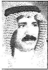
الشيخ مبرك بن العلي الهاملي

*و توجه الشريف احمد بن محمد طالب بخلص الشكر والعرفان لتمام خادم الحرمين الشريفين وسمو ولي عهده الأمين وسمو النائب الثاني بمناسبة صدور الأمرين الساميين تعيين صاحب السمو الملكي الأمير نايف بن عبد العزيز نائباً ثانياً لرئيس مجلس الوزراء وتعيين صاحب السمو الملكي الأمير مشعل بن عبد الله أميراً