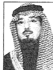
الأمير مشعل بن عبدالله بن عبدالعزيز