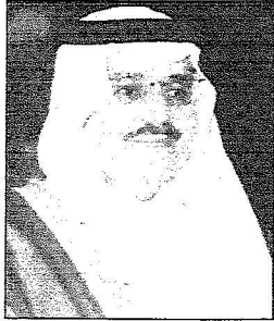
الأمير نايف بن عبدالعزيز

المنشايخ والأعيان والمواطنون في جـران لـ (الريشايض):